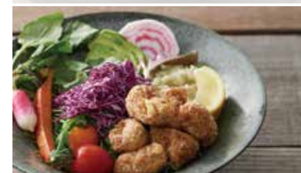
ジューシーソイミートのVEGEからあげ丼

CLEAN EATING BUFFET SET サラダビュッフェセット +1,280yen(税抜)