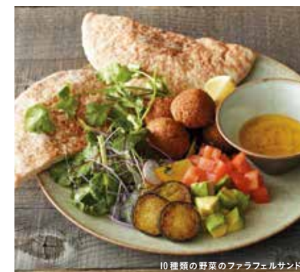
10種類の野菜のファラフェルサンド

ひよこ豆とオリジナルスパイスで作ったボリュームで食べ応えのあるファラフェルを10種類の野菜と一緒にもちりとしたビタパンに挟んでお召し上がりください。