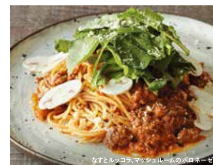
なすとルッコラ、マッシュルームのボロネーゼ

βカロチン豊富なオクラとたっぷりのミョウガ、水菜とともに、疲労回復効果のある山芋のすりおろしで和えた、さっぱりとした柚子こしょう香る和風パスタ。