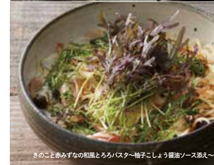
きのこと赤みずなの和風とろろパスタ～柚子こしょう醤油ソース添え～

フレッシュハーブの香りとココナッツミルクの濃厚な味が食欲をそそる、味付けが自慢の一品。